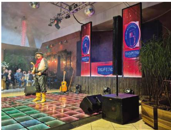
Guri de Uruguiana mais uma vez divertiu o público

Como forma de movimentar a economia local e apoiar as empresas gaúchas, a festa contou com produtos da região e humorista do estado.