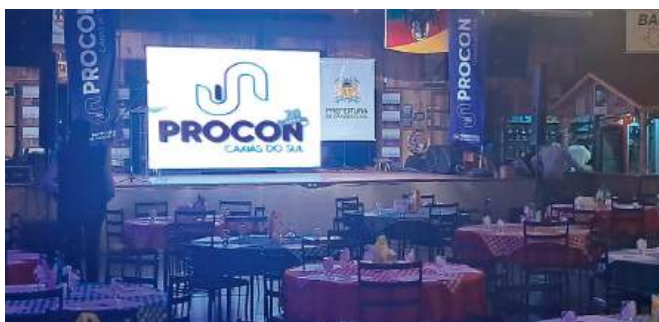
Sindipetro participou do jantar de comemoração