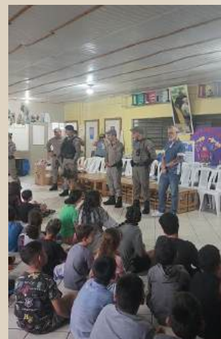
Entidade de Assistência à Criança e ao Adolescente (Enca)