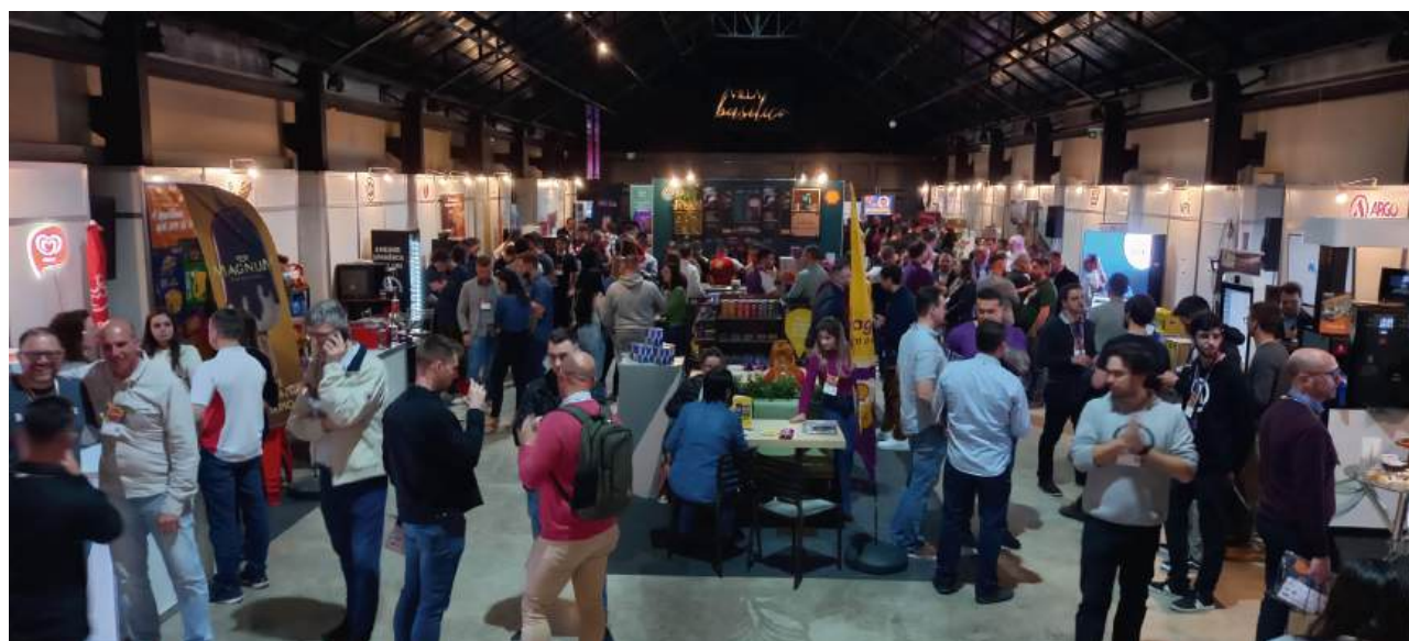
Em 2023 a feira registrou cerca de 600 visitantes, entre proprietários, gerentes e responsáveis do setor de compras

“Como a Expo Conveniências não é para o Sindipetro obter lucro, mas gerar negócios entre fornecedores e revendedores, conseguimos reduzir custos e repassar como benefício para as empresas. A intenção é agregar cada vez mais participantes”, afirma Pioner.