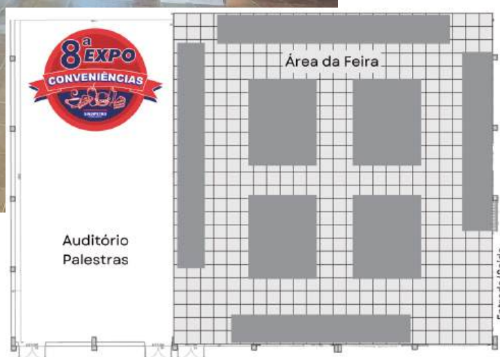
Feira terá mais estandes em relação à última edição