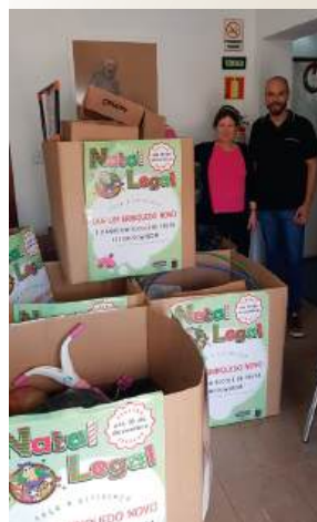
Legião Franciscana de Assistência aos Necessitados (Lefan)