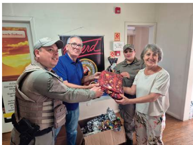
3ºBPAT deixa doações no Centro Espírita Lar da Caridade