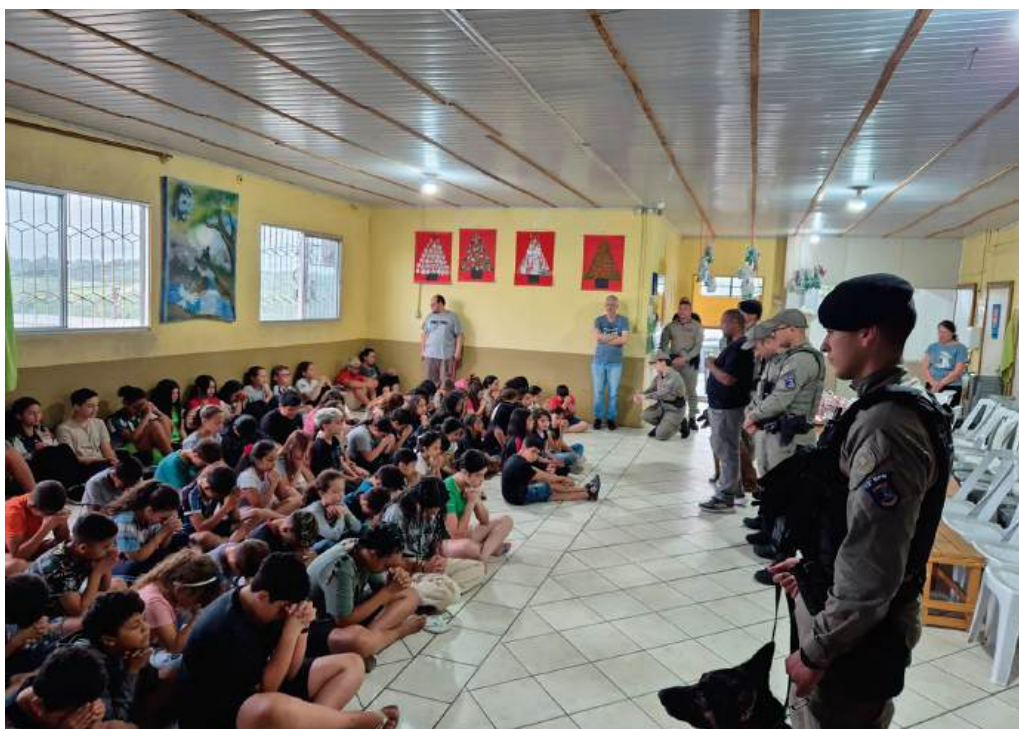
Garotada aguarda ansiosa a entrega de brinquedos pelos policiais do 12º BPM

“São atitudes simples, mas de muito valor e importância para eles. Todos se empenham para a cada edição fazer mais”, destaca Pioner.