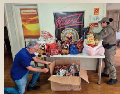
Centro Espírita Lar da Caridade