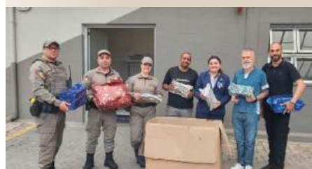
Hospital Geral (setores de pediatria e oncologia pediátrica)