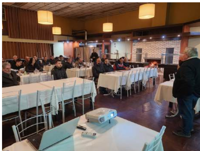
Atividade reuniu cerca de 60 empresários associados

Vários assuntos foram abordados nesta reunião-jantar. Entre eles as ações judiciais contestando a cobrança de PIS e Cofins e a taxa do Ibama. Os seis processos sobre os tributos federais ainda tramitam na Justiça e não têm decisões finais.