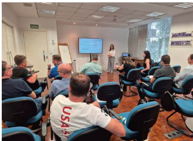
Especialista apresentou e tirou dúvidas sobre aposentadoria